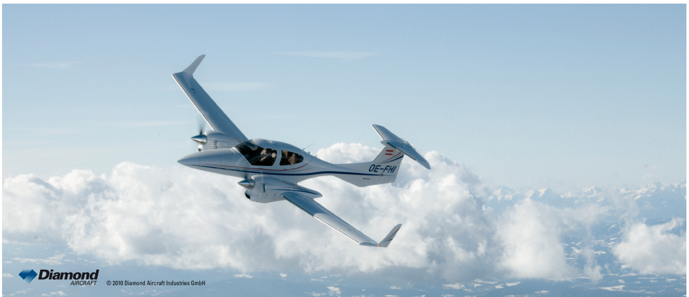
Bild 3: Erprobungsflugzeug Diamond DA42.

MATLAB® und Simulink® sind eingetragene Warenzeichen von The MathWorks, Inc.